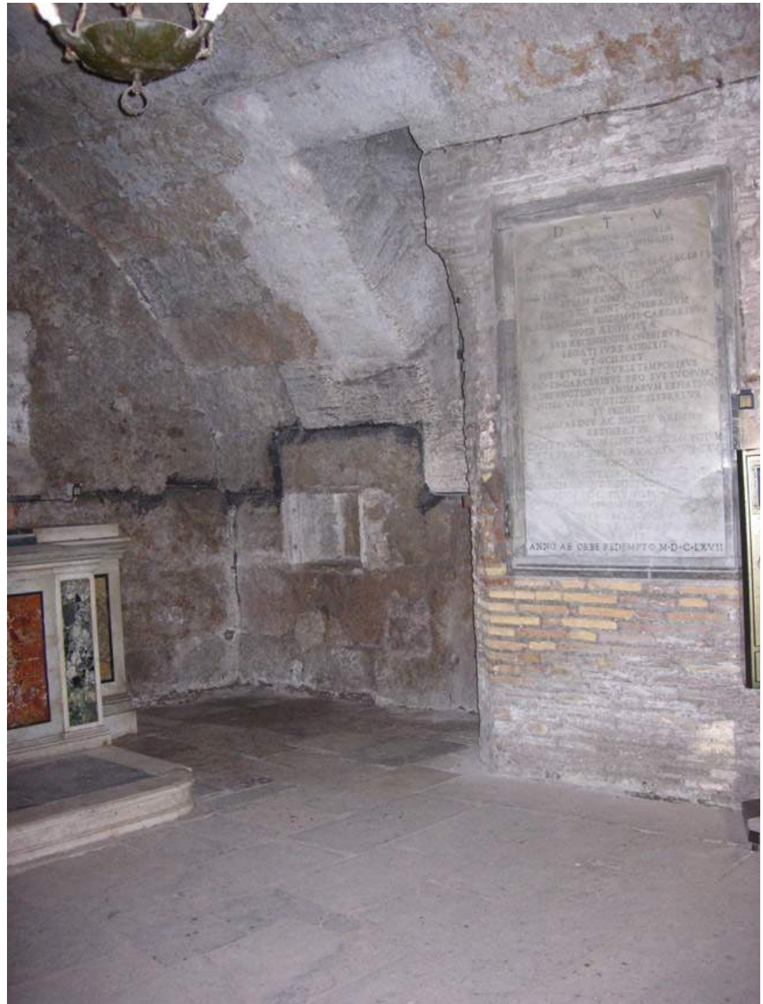
Photo de l'interieur du Tullianum

Un prisonnier dans la prison Tullianum . Image trouvée sur un blog .