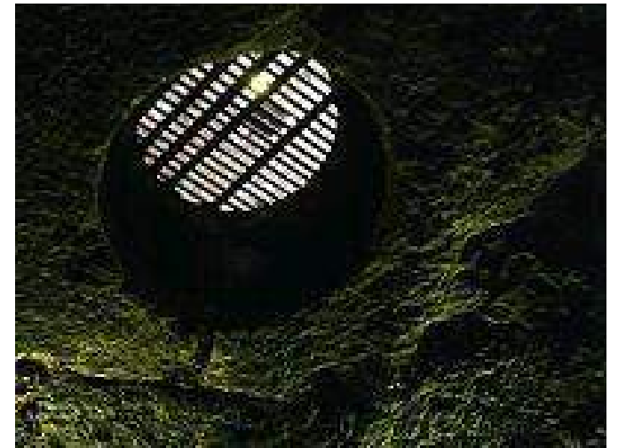
Photo de l'interieur du Tullianum

Voici une ouverture faisant communiquer les deux niveaux du Tullianum .