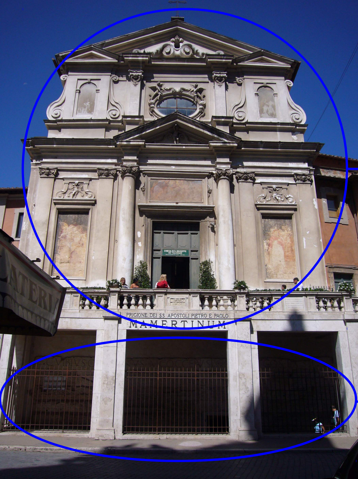
L'église San Giuseppe dei Falegnami.