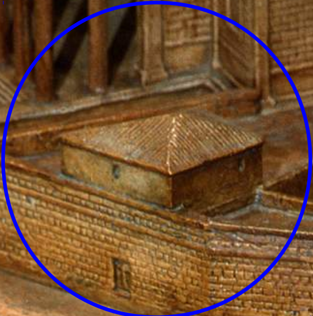
La prison Tullianum .