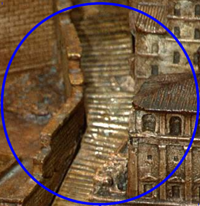
L'escalier des Gémonies .