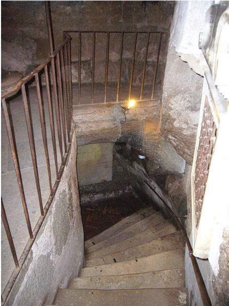
Escalier menant au sous-sol du Tullianum .