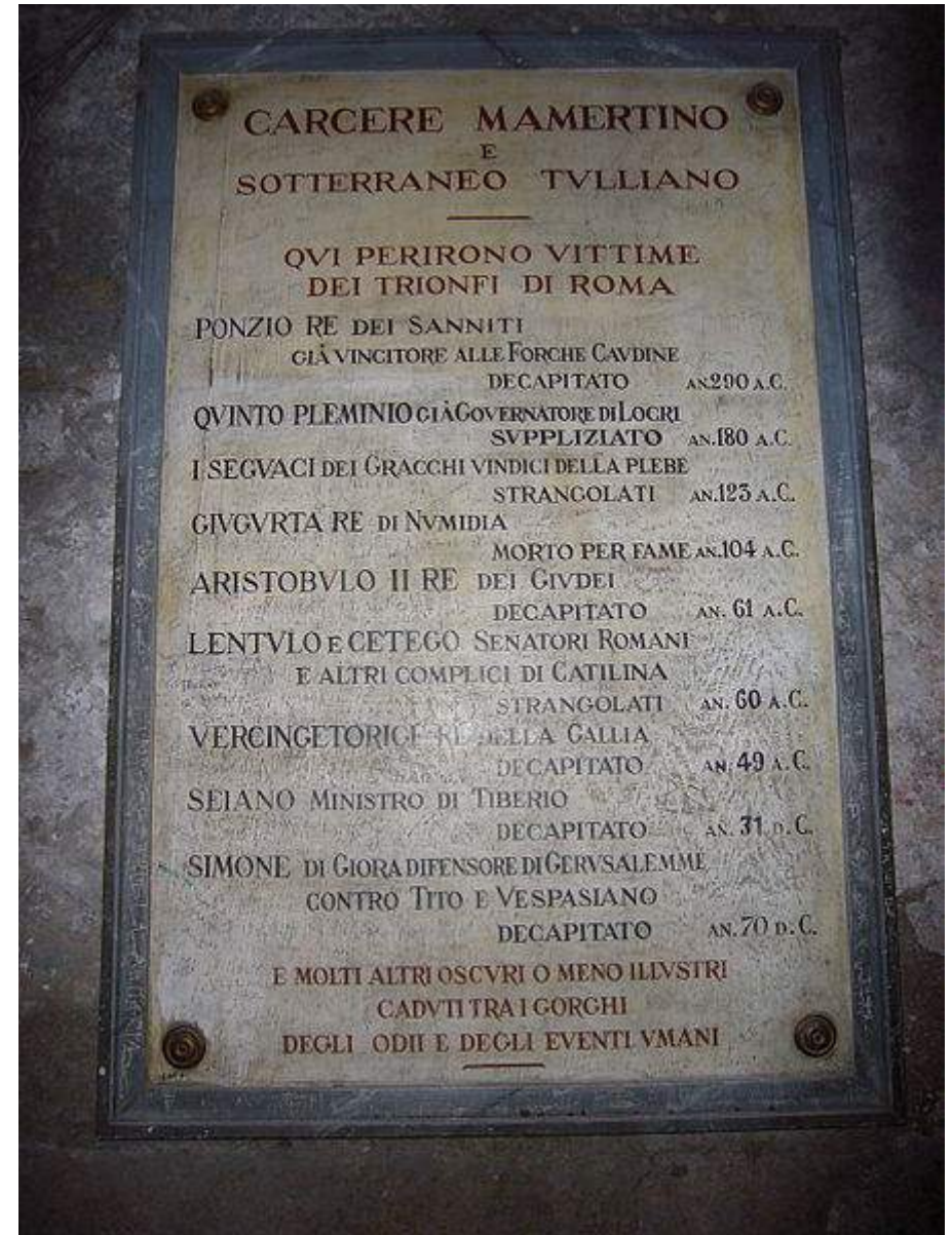
Plaque clouée sur un mur de la prison ; elle dit : Prison Tullianum "Mamertine" souterraine . Victimes qui ont péri pour le triomphe de Rome .