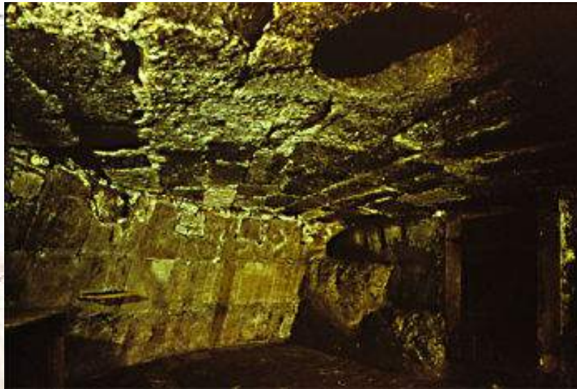
Plusieurs images de l'intérieur de la prison.