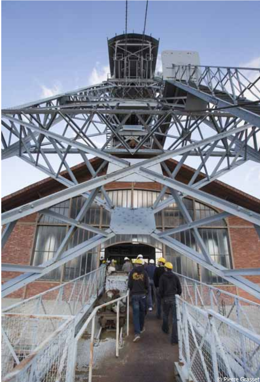
Le chevalement et la recette jour*