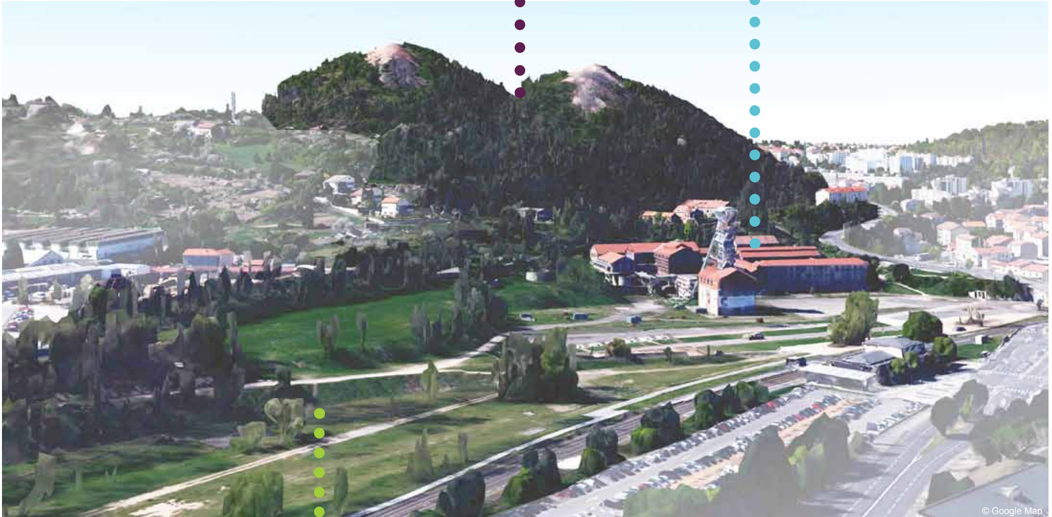
Vue du Site Couriot