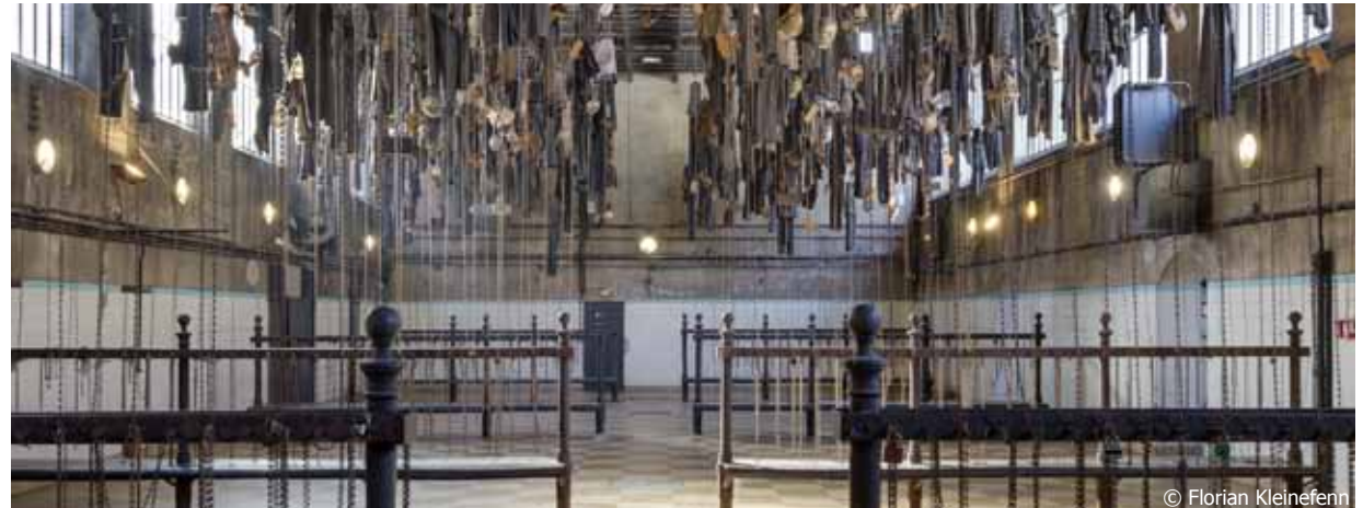
Le lavabo* ou vestiaire des mineurs*

Le choix du musée n'est pas de remettre ces bâtiments à neuf mais de faire quelques rénovations pour que le site reste visitable et ne soit pas dangereux pour le public. En revanche, les traces et les empreintes que le temps laisse sur les bâtiments et dans les différents espaces ne sont pas effacés , elles font aussi partie de l' histoire et de la mémoire des lieux.