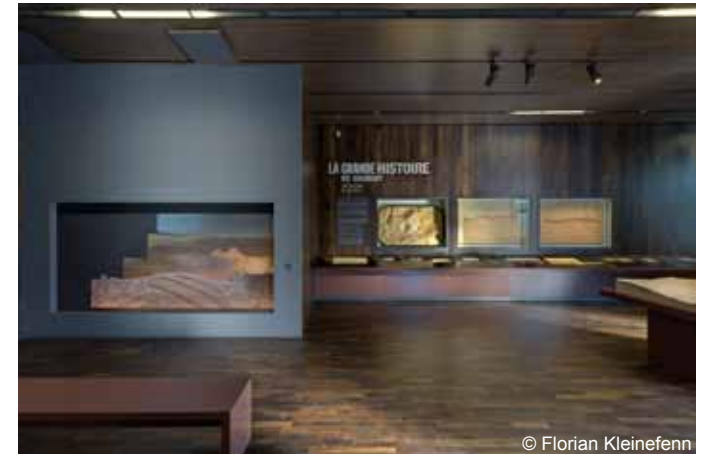
Six siècles d'aventure houillère